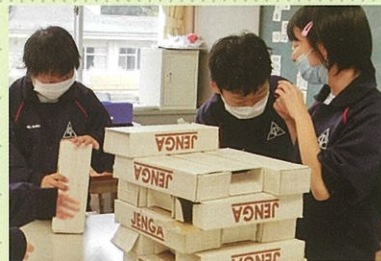
人間関係の形成・コミュニケーション 簡単なルールのあるゲーム

生徒の現在、将来の自立を目指し、一人一人の状態や発達の段階に応じて、コミュニケーション、身体の動き、人間関係づくりなどの学習を行っています。