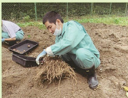
農業園芸班 里芋の収穫

「挨拶・返事・報告をする」「話を聞いて正確に仕事をする」「続けて仕事をする」など、卒業後の職業生活を見据え、実践的な働く力を身に付けます。