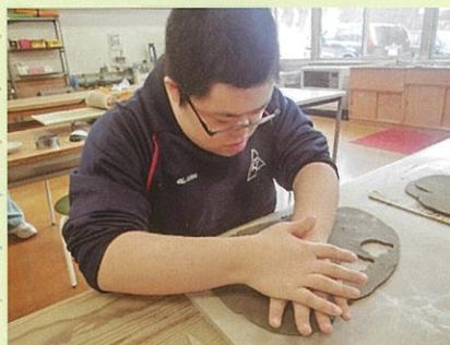
陶工班 箸置き作り