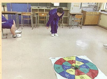
室内ゲームグループ