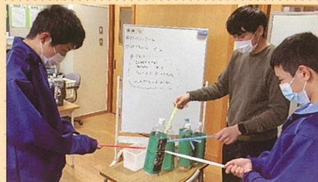
人間関係の形成・コミュニケーション 簡単なルールのあるゲーム

生徒の現在、将来の自立を目指し、一人一人の状態や発達の段階に応じて、コミュニケーション、身体の動き、人間関係づくりなどの学習を行っています。