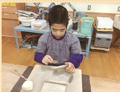
陶芸班 箸置き作り