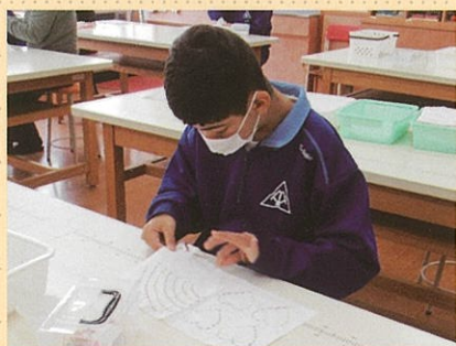
縫製班 刺し子の台ふきん作り

一人一人の適性に合った作業班(陶芸、紙工、木工、縫製、調理、園芸)で、働くことへの関心と意欲を高め、働くために必要な基礎的な力の獲得を目指します。