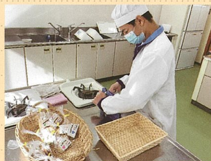
調理班 クッキーの袋詰め