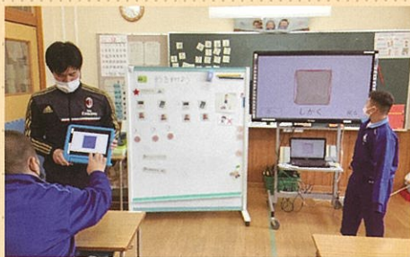
数学 形の仲間集め

日常生活に必要な知識の習得や知識力を高めるために、個々の実態や興味・関心を考慮し、段階的に学習しています。