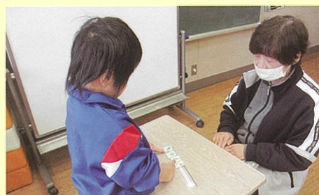
コミュニケーション 要求を伝える学習

児童の現在、将来の自立を目指し、一人一人の状態や発達段階に応じて、コミュニケーション、身体の動き、人間関係づくりなどの学習を行っています。