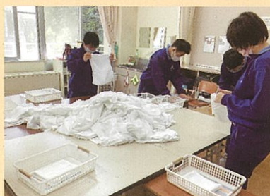
働く人々 ～いろいろな仕事～

買い物や公共施設の利用など、社会生活に必要な事柄を実践的に学習し、生活に生かせる知識や技能を身に付けます。