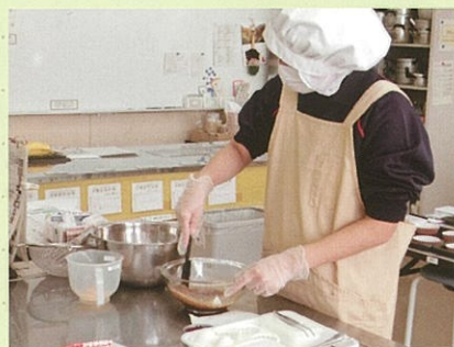
調理班 チョコケーキの生地作り