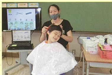
床屋さんに行こう

簡単な調理、お手伝い、買い物など、家庭生活に結び付いた事柄を実際に体験して、生活に必要な知識や技能を身に付けます。