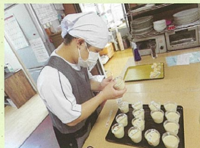
スイーツのラベル貼り