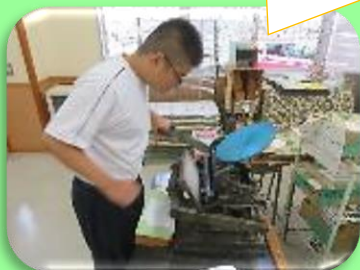
<事務サービス班>メモ帳の印刷

事後学習では、2週間を振り返って今後の目標を考えました。来年度の就業体験に向けて、さらに「働く力」を高められるよう、学校生活や作業学習を通して日々努力していきます。