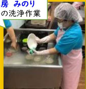
健食工房 みのり 食器等の洗浄作業