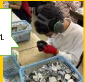
あかり 部品の組付 部品の袋入れ シール貼り