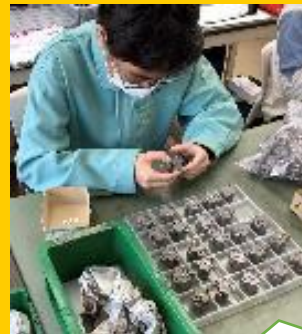
ひまわり 部品の組付け、袋詰め