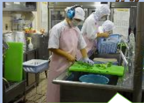
株式会社 メフォス 野菜の切り込み 料理の盛り付け