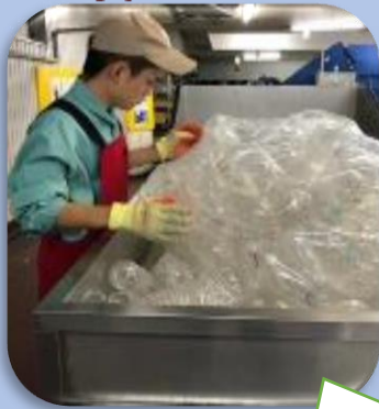
アルビスクリーンサポート株式会社 ペットボトルの選別、タオル畳み