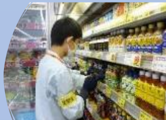
ウエルシアオアシス株式会社 飲料やお菓子の品出し、清掃