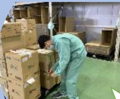
ヤマト運輸株式会社 伝票処理 配達荷物の仕分け ダイレクトメールの封入れ 宛名シールはり