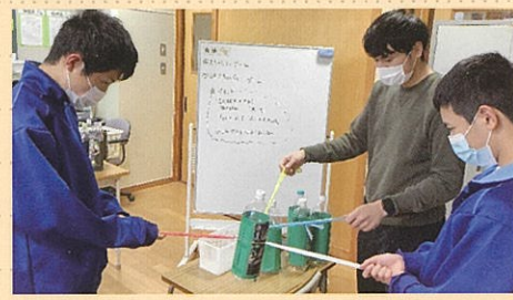
人間関係の形成・コミュニケーション 簡単なルールのあるゲーム

生徒の現在、将来の自立を目指し、一人一人の状態や発達の段階に応じて、コミュニケーション、身体の動き、人間関係づくりなどの学習を行っています。