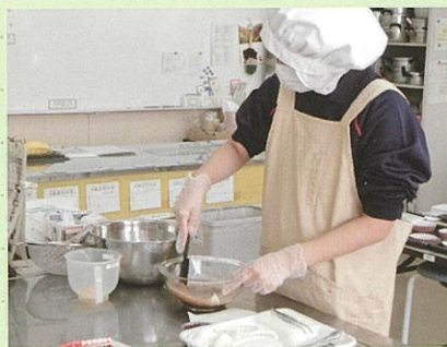
調理班 チョコケーキの生地作り