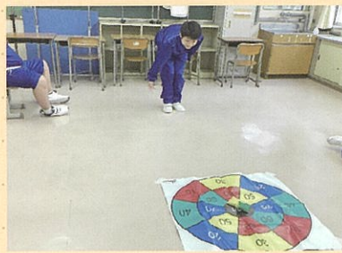
室内ゲームグループ