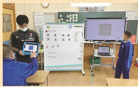
数学 形の仲間集め

日常生活に必要な知識の習得や知識力を高めるために、個々の実態や興味・関心を考慮し、段階的に学習しています。