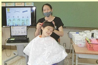
床屋さんに行こう

簡単な調理、お手伝い、買い物など、家庭生活に結び付いた事柄を実際に体験して、生活に必要な知識や技能を身に付けます。