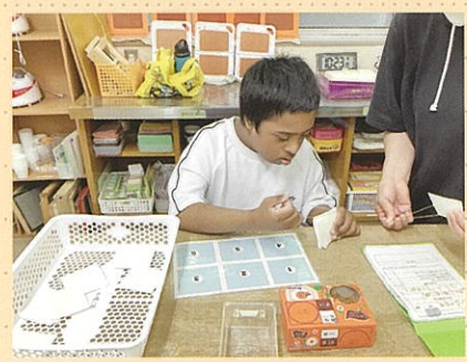
紙工班 廃油処理製品作り

一人一人の適性に合った作業班(陶芸、紙工、木工、縫製、調理、園芸)で、働くことへの関心と意欲を高め、働くために必要な基礎的な力の獲得を目指します。