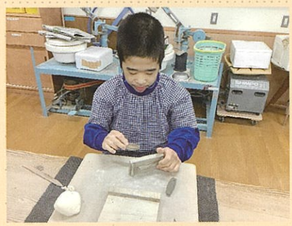
陶芸班 箸置き作り