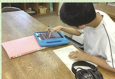
国語 文章を作ろう

生活に結び付いた具体的な活動を学習の中心に据え、卒業後の職業生活や家庭生活に必要な知識と技能を身に付けます。