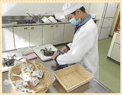
調理班 クッキーの袋詰め