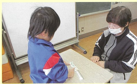
コミュニケーション 要求を伝える学習

児童の現在、将来の自立を目指し、一人一人の状態や発達の段階に応じて、コミュニケーション、身体の動き、人間関係づくりなどの学習を行っています。