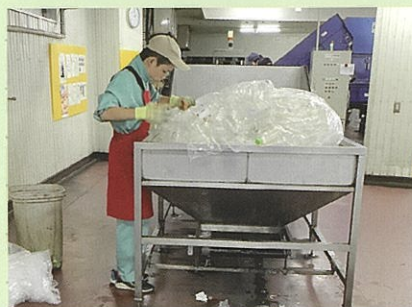
ペットボトルの選別

企業(事業所)や福祉施設など生徒自身の進路希望先での体験の中で、働くことの意味や厳しさを学ぶ機会としています。