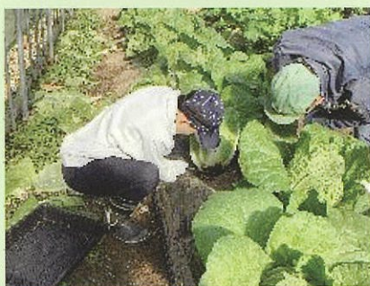
農業園芸班 白菜の収穫

「挨拶・返事・報告をする」「話を聞いて正確に仕事をする」「続けて仕事をする」など、卒業後の職業生活を見据え、実践的な働く力を身に付けます。