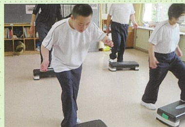
身体の動き 踏み台運動

生徒の現在、将来の自立を目指し、一人一人の状態や発達段階に応じて、コミュニケーション、身体の動き、人間関係づくりなどの学習を行っています。