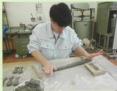
陶工班 ひもづくり