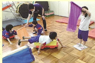
キャスターボード

いろいろな遊びを通して、友達や教師との関わりを促し、意欲的に活動する態度を育てます。